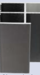
Clips geleider 40