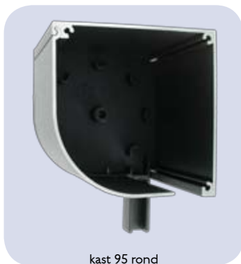
kast 95 rond