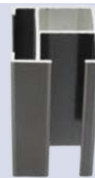
Clips geleider 28