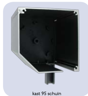
kast 95 schuin

Screens kunnen op drie manieren bediend worden: