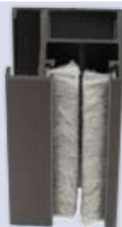
Clips geleider 28 met borstel