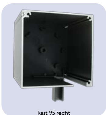
kast 95 recht